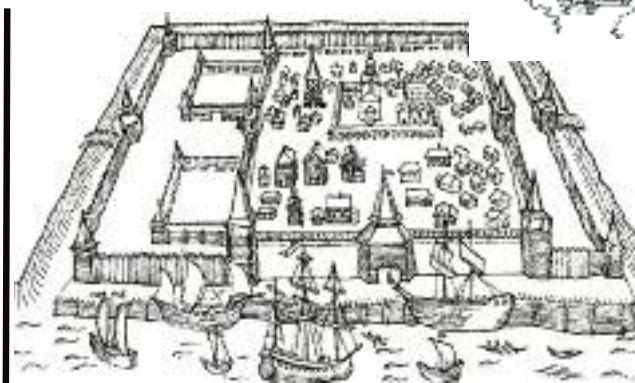
2 Иллюстрации из книги В. Глазычева в соавт. с А. Гутновым «Мир архитектуры. Лицо города»